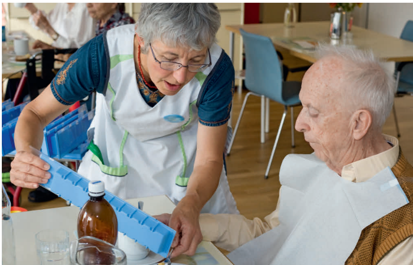
Betagte Männer und Frauen vertragen etliche Medikamente aufgrund eines veränderten Stoffwechsels nur schlecht. Dazu gehören auch Psychopharmaka, die in Pflegeheimen oft verschrieben werden.